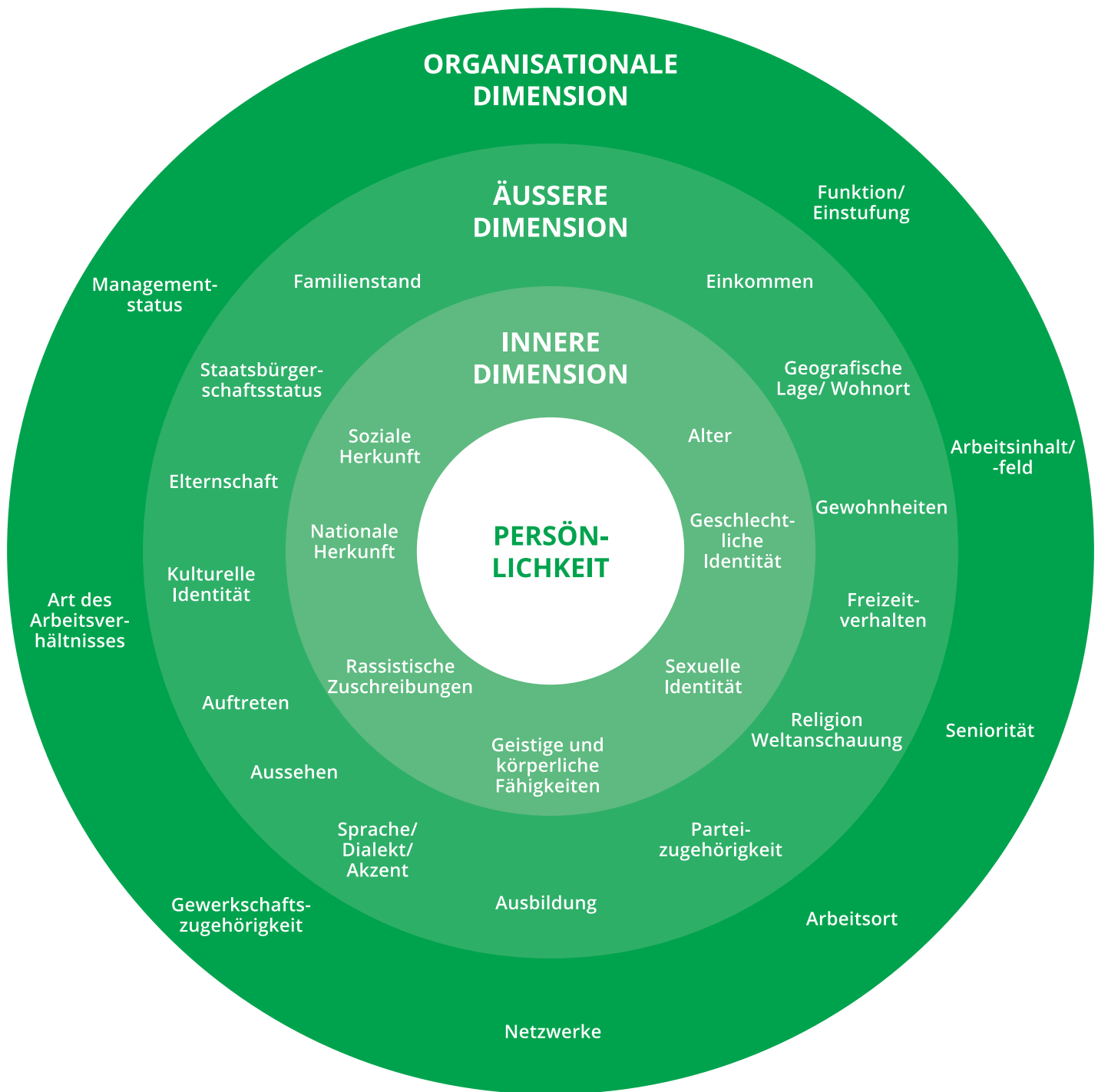
Abb. 1: Persönlichkeitsdimensionen innerhalb einer Organisation

Die Merkmale, die die Persönlichkeit eines Menschen im Kontext einer Organisation beschreiben, werden in dieser Grafik entlang von drei Dimensionen erfasst: